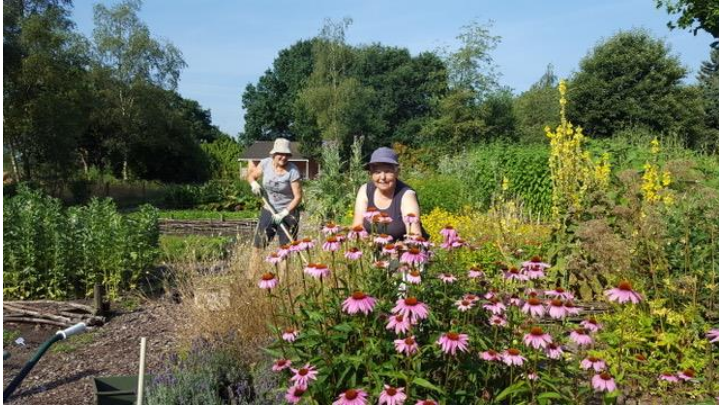
Bloemenpracht in de tuinderij

De korenbloem, klapproos en ganzenbloem werden een zeldzaamheid, de patrijs, die gedijt in korenvelden, verdween. Waardevolle bermen, randen en zoombeplantingen kwamen onder druk te staan en veel houtwallen verdwenen of werden sterk verwaarloosd doordat ze hun functie verloren. Dit was de situatie die wij rond 2000 aantroffen in het gebied Stelt-Elzen, een sterk vermist gebied met monotone akkers van hoofdzakelijk mais en een enkele verwaarloosde paardenwei.