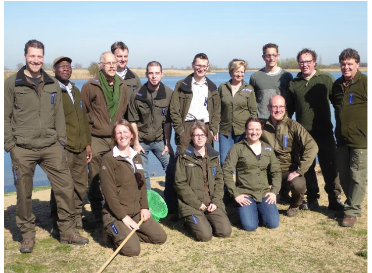
De voltallige ploeg van het beheerteam Noordoost Brabant en Rijk van Nijmegen