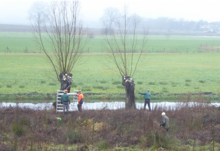
Landschapsbeheer snoeit wilgen aan de dijk in Megen in 2017

Elly van Doorn Gebiedsbeheerder Waterschap Aa en Maas