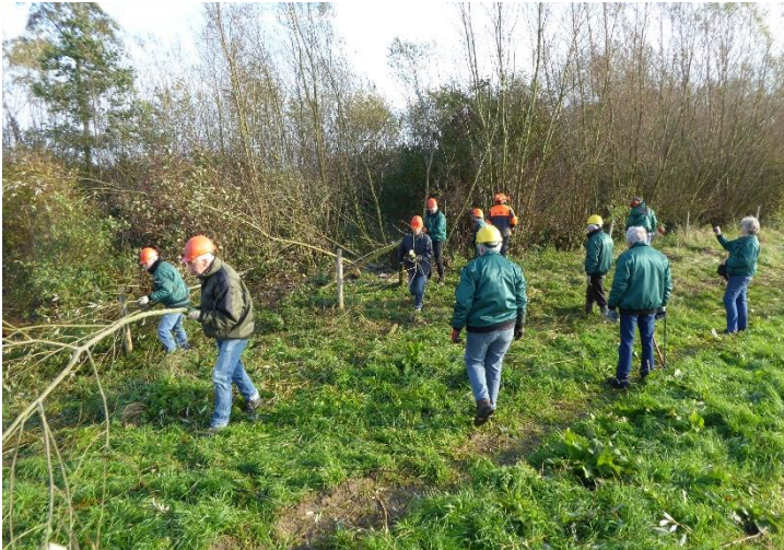
Natuurwerkdag van Landschapsbeheer-Oss bij Het Gat van de Dam