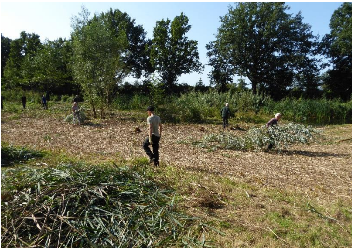
Na snoei- en kapwerk