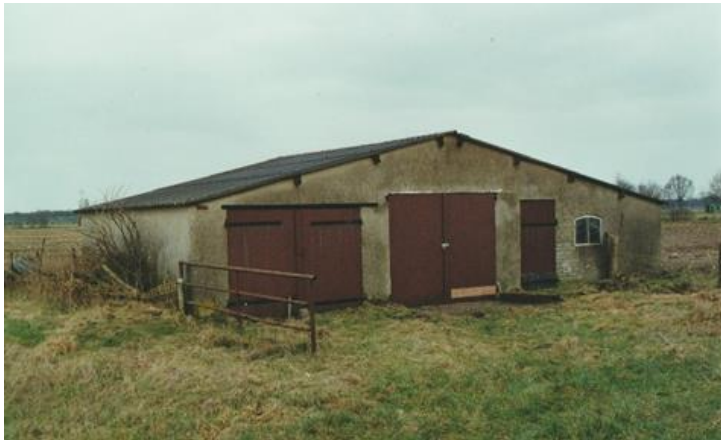
In de beginjaren gebruikten we het middelste deel van een schuur achter een woning aan de Tolstraat

Met de toename van het aantal vrijwilligers werd ook de behoefte aan ruimte voor het opbergen van gereedschappen en materialen steeds groter. In het begin van ons bestaan maakten we gebruik van een deel van een schuur, achter een (inmiddels gesloopte) woning aan de Tolstraat.