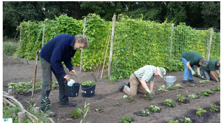
Vrijwilligers bezig in de groentetuin

Het lijkt al weer een hele tijd geleden dat het eerste zaaiplan werd gemaakt voor de Tuinderij VanTosse. Natuurlijk zijn er een heleboel handelingen aan vooraf gegaan voordat het zo ver was. Maar 2014 werd ons eerste jaar van inplanten en zaaïen, van heggertjes maken van wilgentenen. Het was een jaar waarin veel gebeurde. Er was en is veel enthousiasme. We hebben mensen zien komen en ook weer zien weggaan.