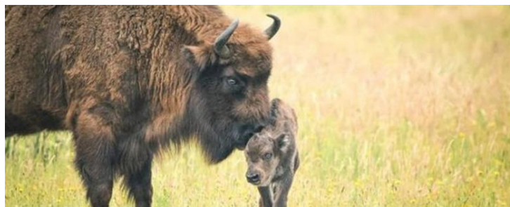
Foto van eerder geboren wissent kalfje

Wisentkoeien zonderen zich vaak enigszins af van de groep als de geboorte van een kalf zich aandient. Het dan ook zomaar zijn, dat het kalf al enkele dagen in het bos verstopt lag. Vanwege het beperkte zicht kon het geslacht van het jonge dier op 6 september nog niet vastgesteld worden. Het feit dat er dit jaar in de Maashorst weer kalfjes geboren zijn, betekent dat de wisenten er in goede omstandigheden leven. Het gebied biedt de kudde voldoende voedsel. In andere gebieden is bekend dat ze om het jaar kalfjes krijgen.