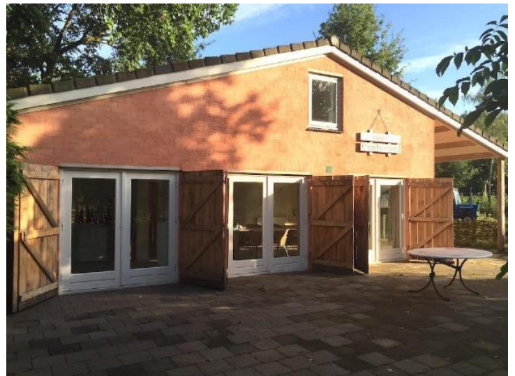
Huis Cumberland