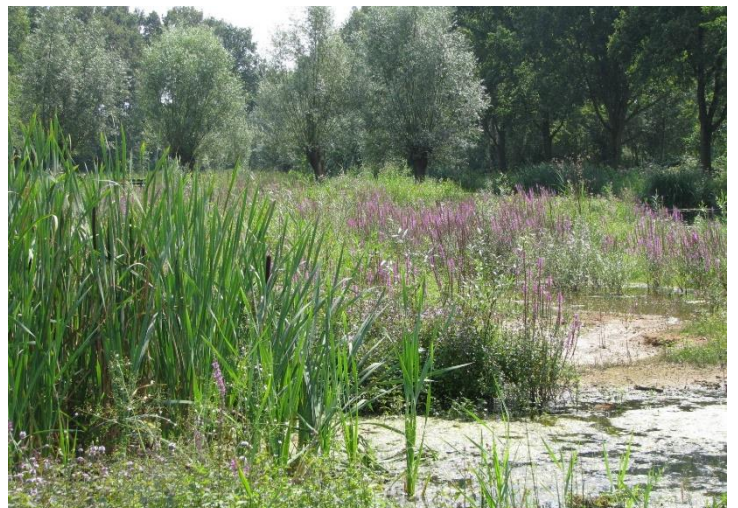
Oude situatie