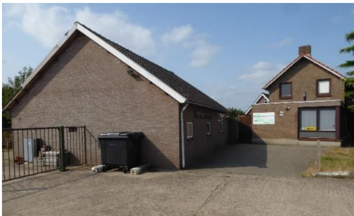
Huidig kantoor en werkplaats aan de Tolstraat

Daarna kregen we de beschikking over de garage van ons huidige home aan de Tolstraat 3 en vervolgens konden we naast de garage óók de woning en de schuur van dat pand in gebruik nemen.