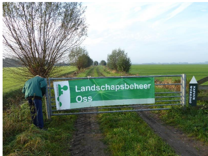
Oprit naar de locatie Gat van de Dam