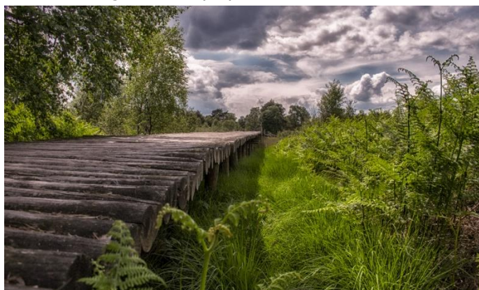
Voorbeeld van een knuppelbrug

Stichting Vrijwillig Landschapsbeheer Uden, IVN en Vogelwacht willen de wijst in het bosje toch beleefbaar maken voor bezoekers. Zij willen dit doen via de aanleg van een 100 meter lange knuppelbrug over het meest natte stuk. Een knuppelbrug vormt een waardevolle aanvulling op de toeristisch-recreatieve infrastructuur van de wijst. Door de aanleg van één knuppelbrug van 100 meter kunnen er maar liefst vier nieuwe "ommetjes" worden gerealiseerd. Via een crowdfunding, waaraan door particulieren, recreatiebedrijven, de provincie en Staatsbosbeheer werd meegedaan, werd in zes weken het voor de knuppelbrug benodigde bedrag van 10.500 euro bij elkaar gebracht. De drie bovengenoemde organisaties hopen de knuppelbrug in september klaar te kunnen hebben. We publiceerden ook in juni 2011 en maart 2013 al iets over de wijstverschijnselen en met name over het Sint Annabos. Bioloog Nico Ettma, regiomanager van IVN-Brabant, schreef er in 2010 een boekje over "Vijf Wijstverschijnselen in Noord-Brabant". Hij meldde ons dat hij nog enkele exemplaren heeft en als men wil kan hij het ook gratis mailen via Nico.ettma@gmail.com. (DR)