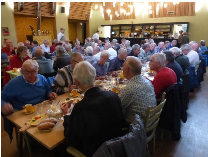
Aan de lunch bij bezoekerscentrum Groot Speijck in Oisterwijk op 8 september 2017