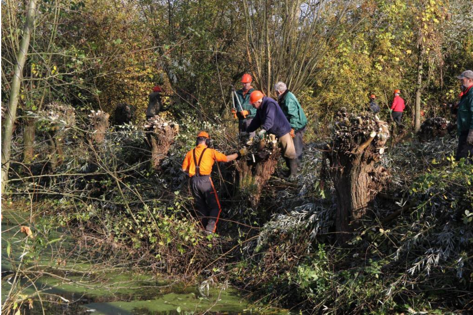
Vrijwilligers aan het werk bij de poel in Dieden