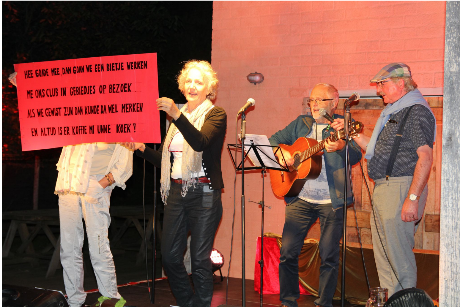
Viering 20-jarig bestaan bij het Huis Cumberland in de Tuinderij VanTosse