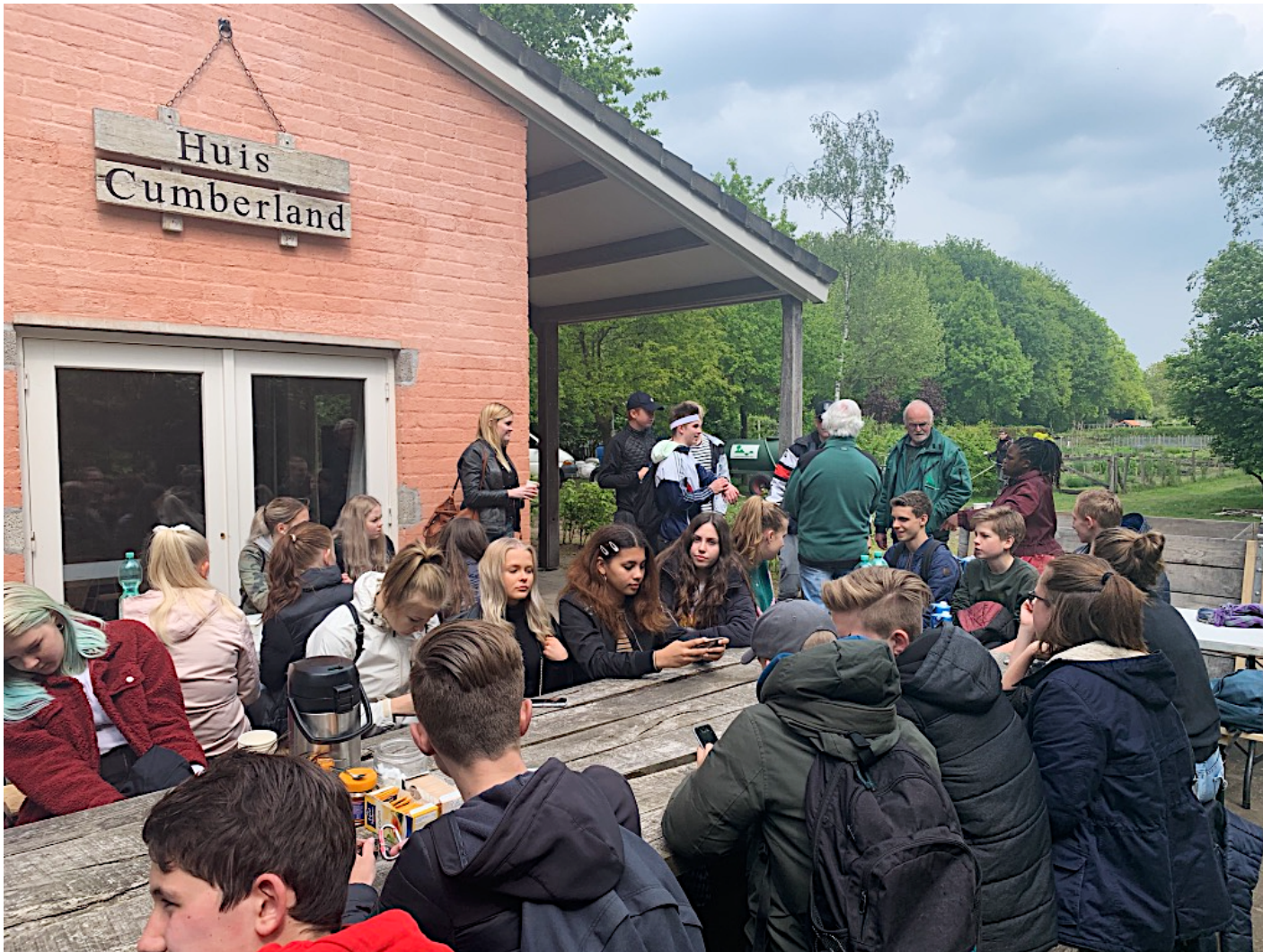
Scholieren tijdens de Jongeren Bedrijvendag op de Tuinderij VanTosse