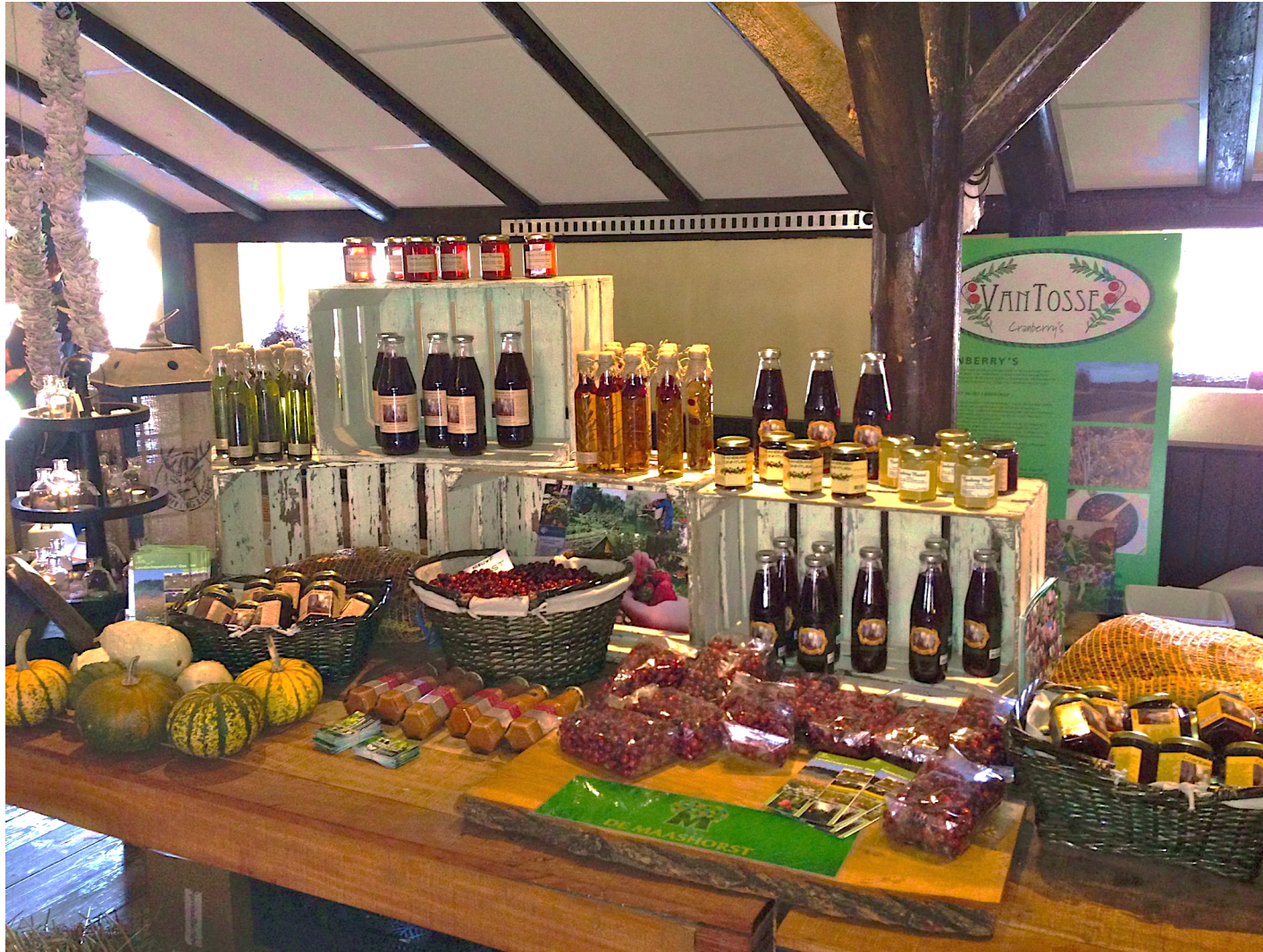
Productpresentatie op streekmarkt