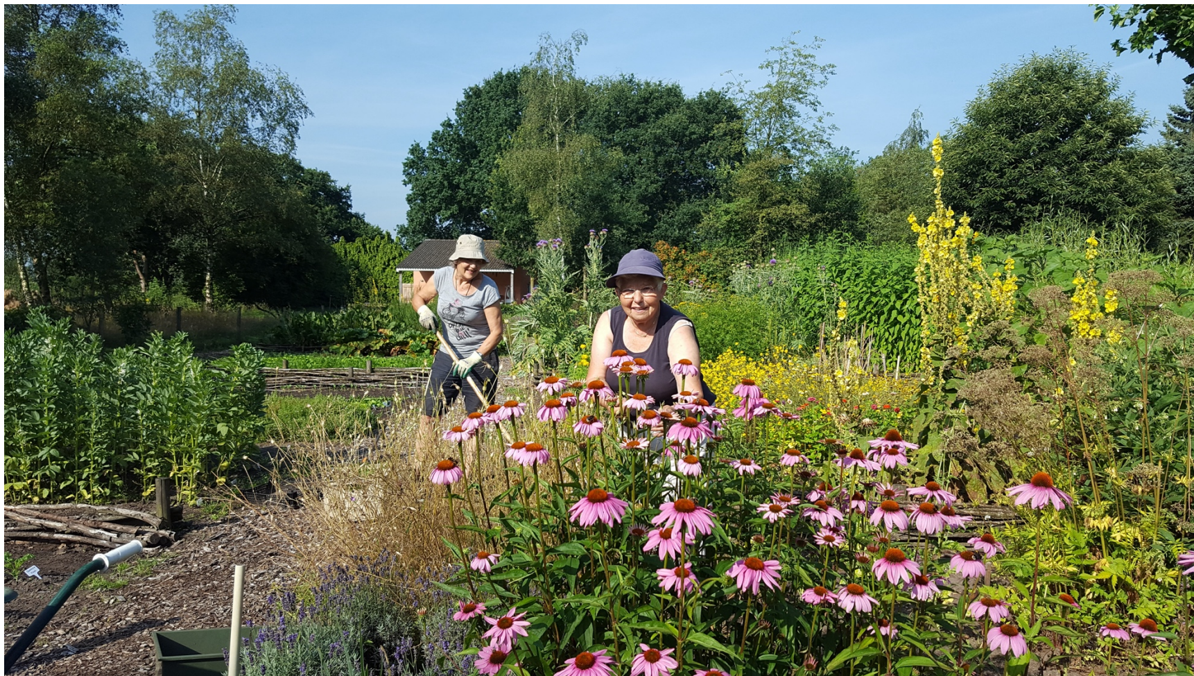
Vrijwilligers in de Tuinderij VanTosse