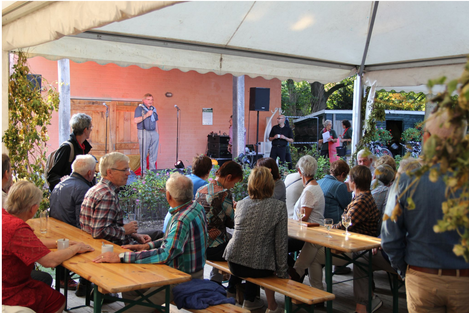
Viering 20-jarig bestaan bij het Huis Cumberland in de Tuinderij VanTosse