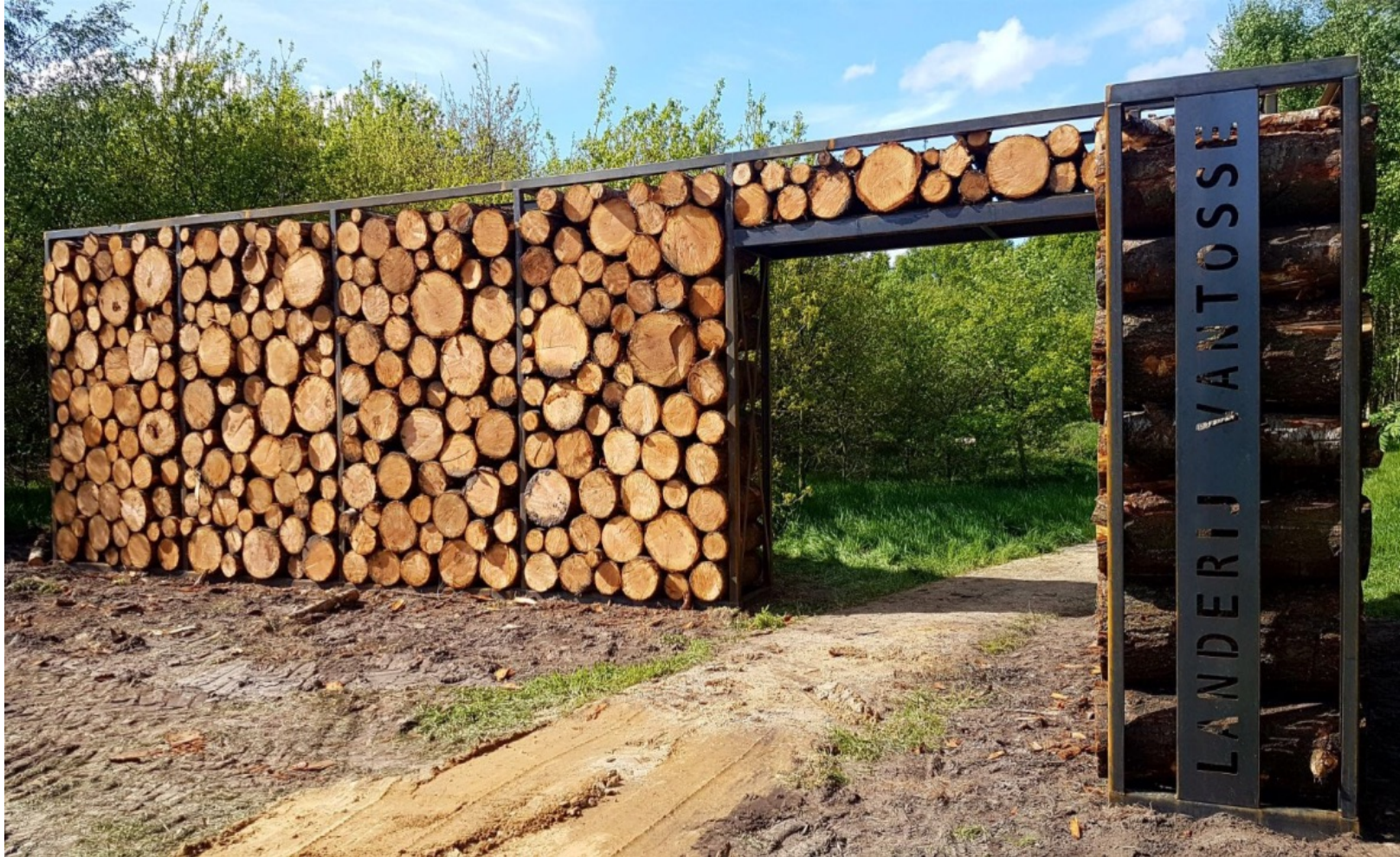
Entreepunt Landerij VanTosse aan de Mughevelstraat