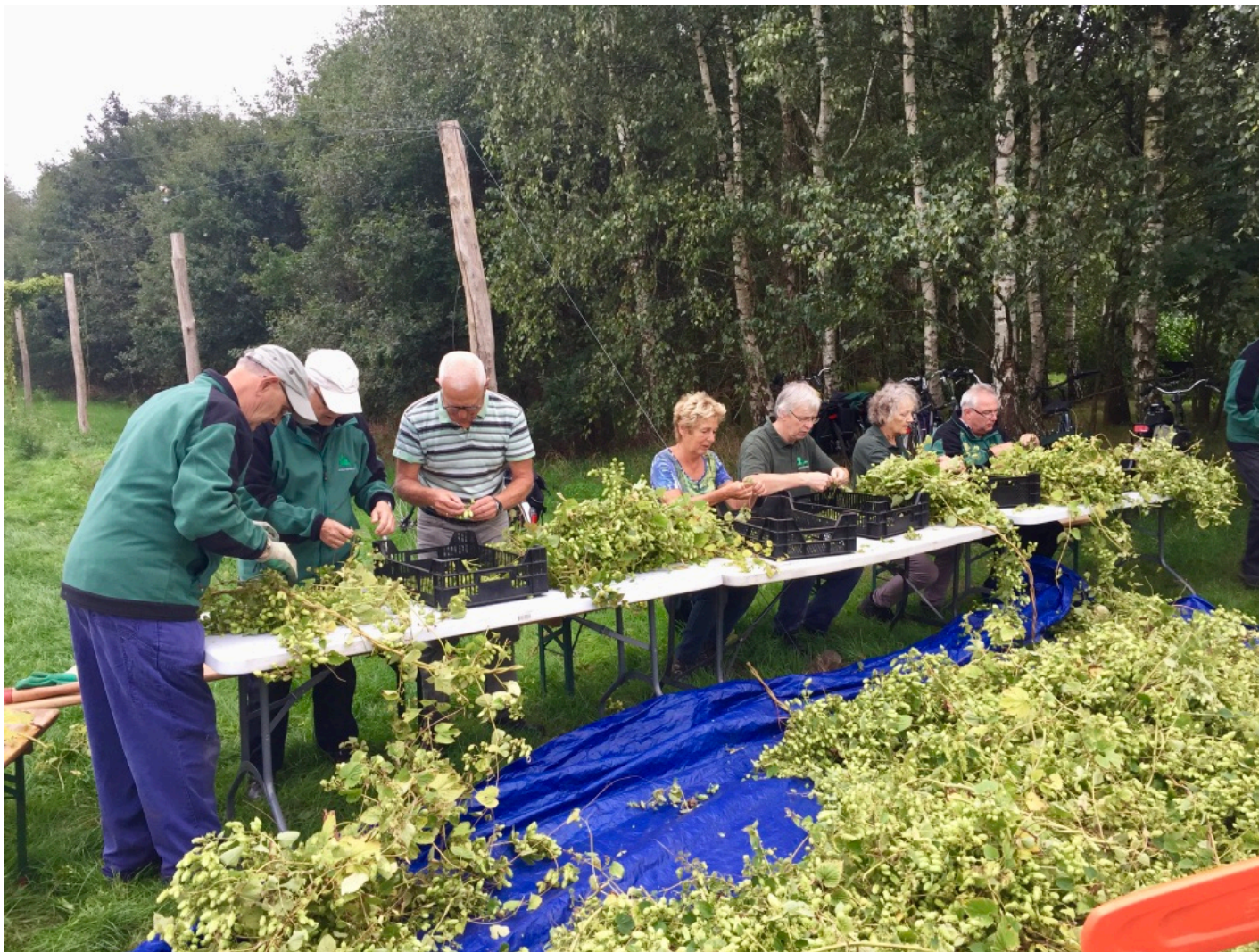
Hopogst in de Landerij VanTosse