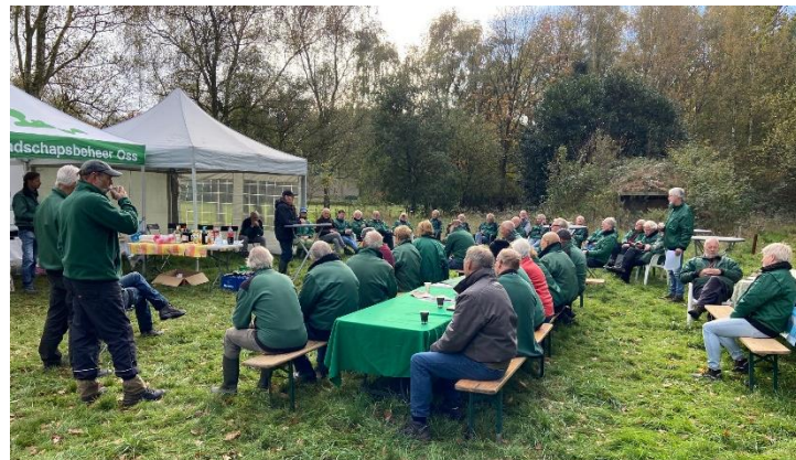
Interessante lezing tijdens landelijke natuurwerkdag in Geffen