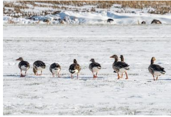
Eenden in de nabijheid van Haren