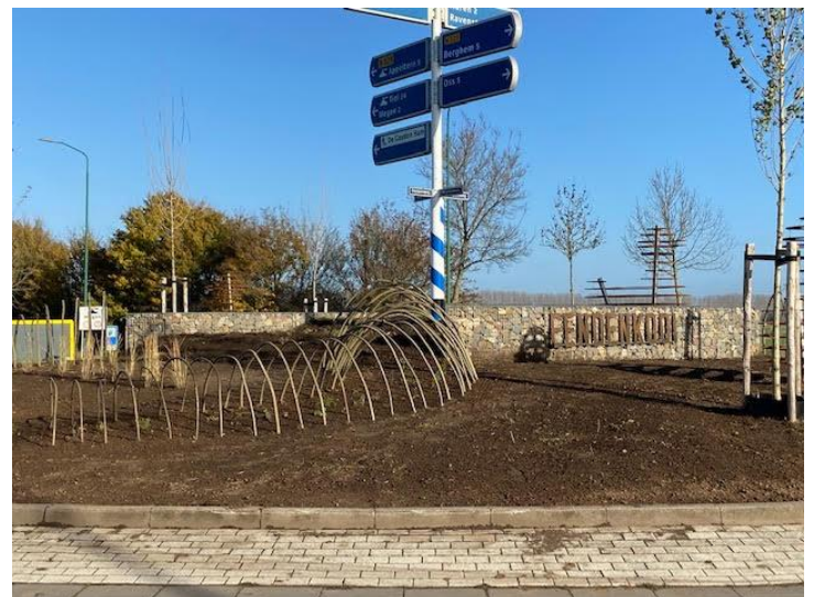
Kunstwerk op rotonde Megensebaan-Dorpenweg