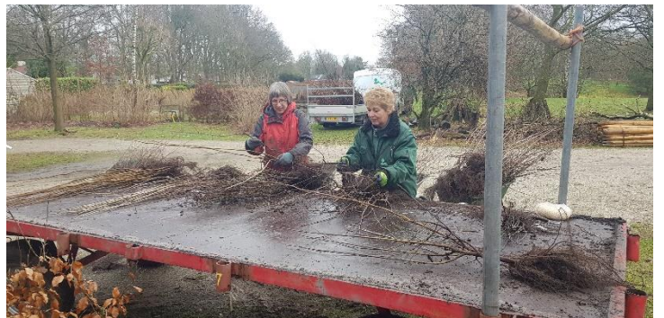
Sorteren van de vele bosplantsoen- en haag planten