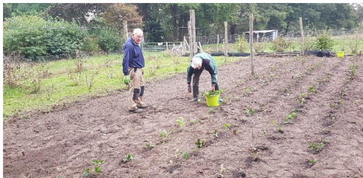
In de herfst was er nog veel werk te verrichten in de tuin

Iedere dinsdag klusjesochtend op onze Landschapswerf aan de Tolstraat 3, 5342 NH Oss tussen 9.00-12.00 uur. Telefoon 0412-474322.