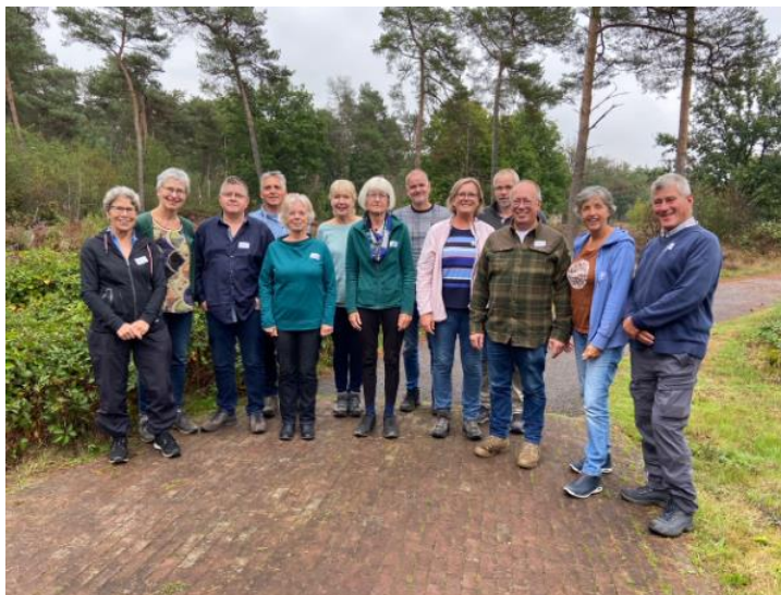
Van links naar rechts: