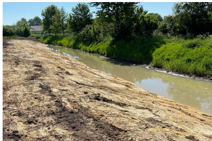
Foto van deelproject Middelveldse beekloop