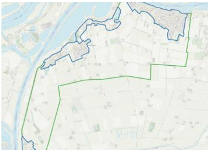
Projectgebied Oeverwal in Vogelvlucht (Lith, Maren-Kessel en 't Wild)