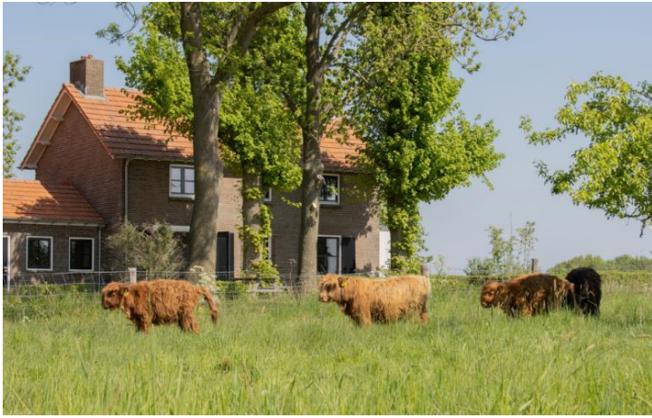
Natuurhuisje Grazelands in Keen