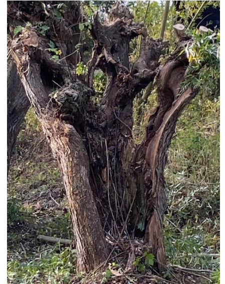
Oude knotwilg ij Dieden (foto: TvH)

Wat vooral ook erg fijn is, is dat we een onderverdeling zien ontstaan in lokale groepen ondersteund door de basisgroep vanuit Oss. Denk hierbij aan groep Maasdonk, waar we al jaren mee samenwerken, en aan de groepen in Maren-Kessel en Lithoijen, die vooral in hun eigen woonomgeving actief zijn. Heel modern noemen we dit "zelfsturende groepen", maar het werkt perfect en is heel goed voor het lokale draagvlak. Sinds kort hebben we ook een samenwerking afgesproken met het Arboretum in Geffen, ook daar een eigen groep, ondersteund door onze grote basisgroep. Tel daar nog bij op onze eigen onvolprezen vrijwilligers in de tuin van Lande-rij van Tosse en je komt op jaarbasis zo maar uit op plm. 18.000 uur!!! aan vrijwilligerswerk wat wij/jullie besteden aan de natuur in Oss.