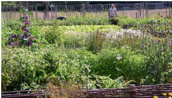
Heel de tuin in Landerij VanTosse gaat op de schop

Afgelopen jaar hebben we bij wijze van proef in de groentetuin olifantsgrassnippers ( miscanthus ) gestrooid tussen plantjes van kool, sla, aardbeien. Met wisselend succes overigens. Aanvankelijk remde het de kieming van onkruid, maar na verloop van tijd begon met name gras en knopkruid er doorheen te groeien. Ongeschikt bleek het ook wanneer er ter plaatse gezaaid moest worden (bieten, snijsla, Nieuw-Zeelandse spinazie), omdat zaden niet kunnen kiemen zonder in direct contact te zijn met de grond. Dus hier bleef onkruid zijn kans ruiken. Tweede nadeel was ook wel dat er nogal wat snippers in bijvoorbeeld andijvie en sla terecht kwamen die er lastig uit te wassen waren. En dat kauwt niet lekker.