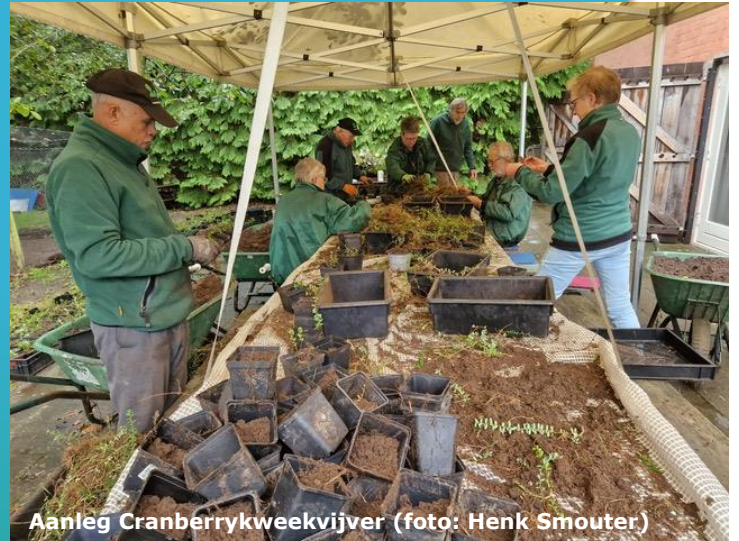
Aanleg Cranberryweekvijver