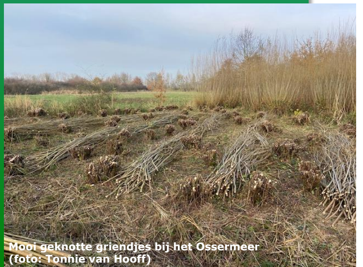
Mooi geknotte griendjes bij het Ossermeer