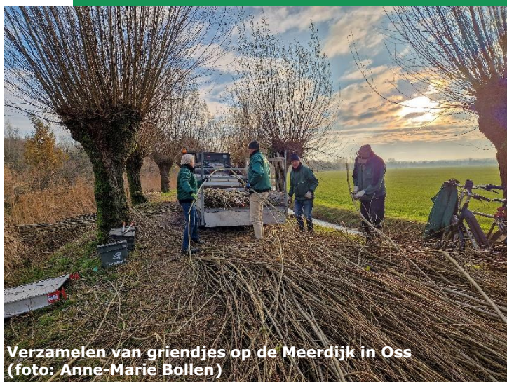
Verzamelen van griendjes op de Meerdijk in Oss