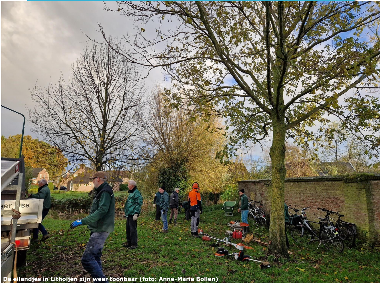
De eilandjes in Lithoijen zijn weer toonbaar