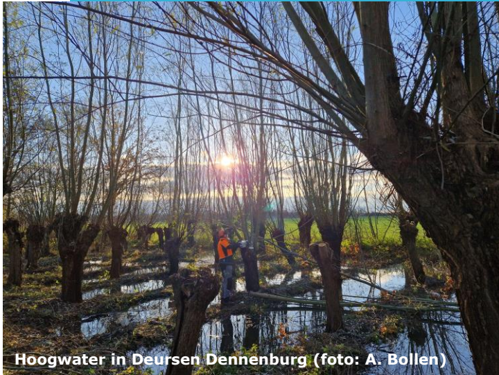
Hoogwater in Deursen Dennenburg