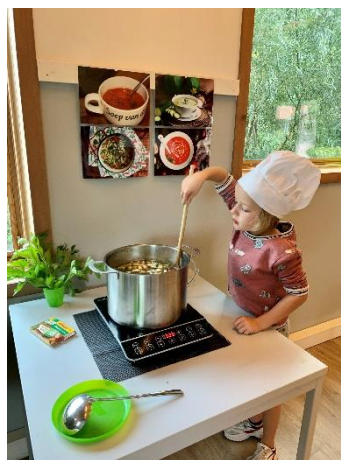
In het leslokaal van Natuurcentrum De Elzenhoek