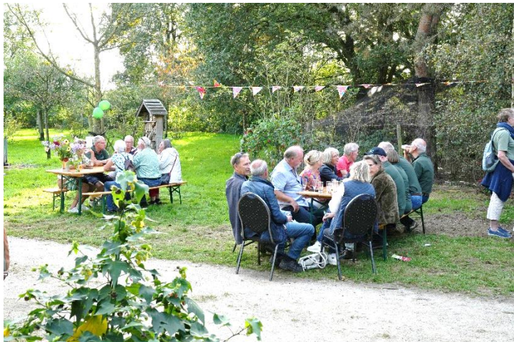
Impressie van een geslaagde feestdag