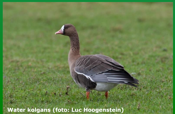
Water kolgans