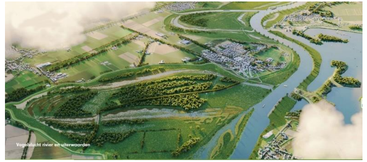
Foto van de website van "Meanderende Maas"