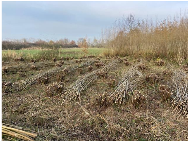
Geknotte griendknotbomen bij het Ossermeer