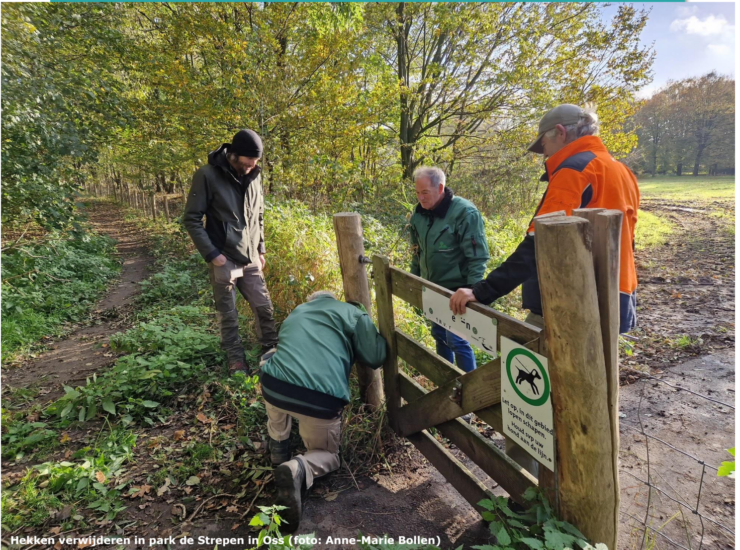
Hekken verwijderen in park de Strepen in Oss