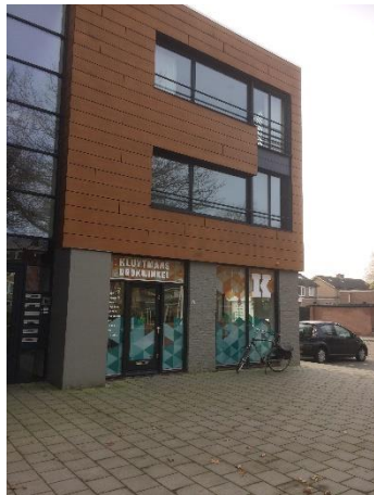
Drukkerij Kluytmans